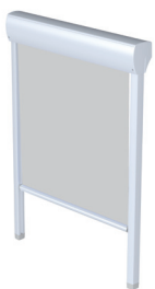
FM 101/201 Schienenführung