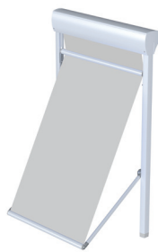
FM 102/202 Schienenführung, mit Ausfalleinheit