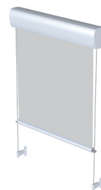
FM 104/204 Stabführung