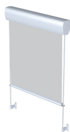
FM 103/203 Seilführung