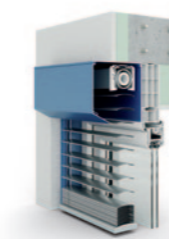
Vorbaujalousie 20° 80er randgebördelte Lamelle AR 80 ECN.