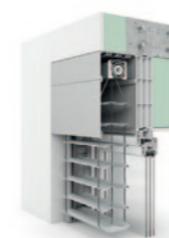
U-Kanal, stranggepresst 92er S-Lamelle AR 92 S.