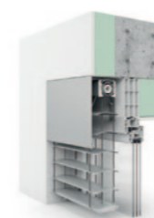
Winkelblende, rollgeformt 80er randgebördelte Lamelle AR 80 ECN.

Individuell abgestimmt. Durch eine Vielzahl von Lamellen-Typen behalten Sie neben nutzbringenden Eigenschaften auch die Gestaltung und Fassaden-Integration Ihres zukünftigen Jalousie- oder Raffstore-Behangs mit der passenden Kastenform im Blick.