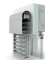
Rund-Kanal, stranggepresst 80er randgebördelte Lamelle ARO 80.