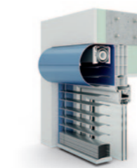
Vorbaujalousie Rund 80er randgebördelte Lamelle AR 80 ECN.