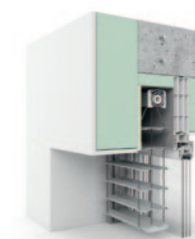
Putzträgerelement, rollgeformt 92er Z-Lamelle AR 92 Z.