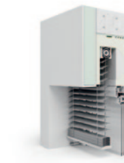
Thermo NB RA-RS 80er randgebördelte Lamelle AR 80 ECN.