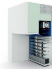
Vorbaujalousie Putzträger 20° 80er randgebördelte Lamelle AR 80 ECN.