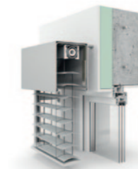
U-Blende, rollgeformt 80er Flachlamelle AF 80.