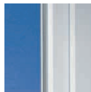
Klassisches Design mit weicher Kontur