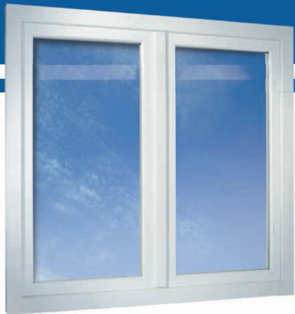
2-flügeliges Fenster in flächenversetzter Variante